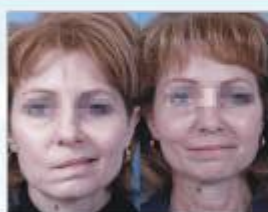
圖1：左圖為「右臉」顏面神經麻痺患者；右圖為該患者經復健治療後，復原良好