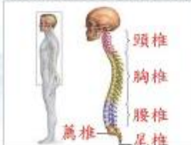
圖3：人體脊椎：頸椎的正常弧度為前凸狀