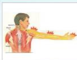
圖2：頸椎壓迫症候群