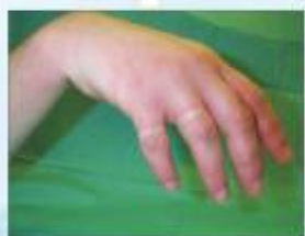
圖7：腕神經損傷造成垂手