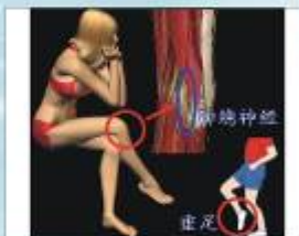
圖11：腓總神經損傷造成垂足