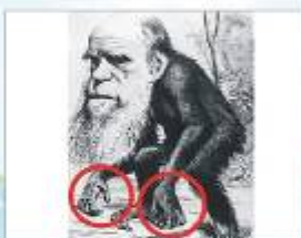
圖8：正中神經損傷造成成人猿手