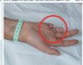
圖9：尺神經損傷造成猿猴手